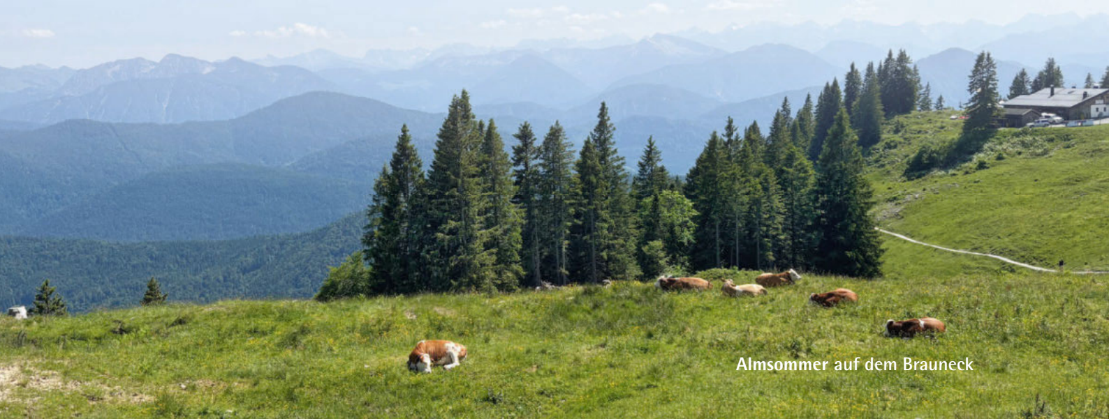
Almsommer auf dem Brauneck

Hintergrund dieser Maßnahmen waren der Ausbau von Wildbächen sowie die Sanierung von Almen, für die eine Erschließung zwingend notwendig war. Zur Almsanierung gehörten unter anderem die Verbesserung der Wasserversorgung, die Sanierung und Neuanlage von Mist- und Güllelagerstätten sowie die