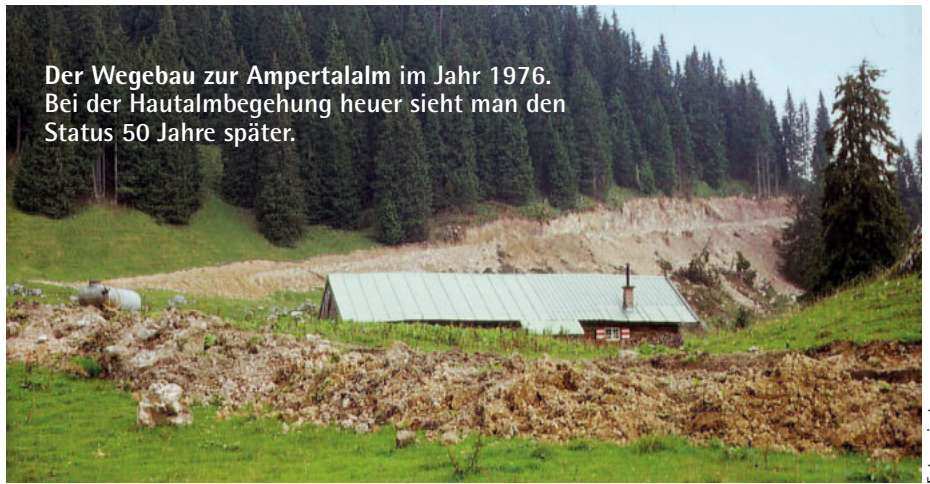
Der Wegebau zur Ampertalalm im Jahr 1976. Bei der Hautalmbegehung heuer sieht man den Status 50 Jahre später.

Neben der Lärchkogalm prägt auch die weitläufige Moosenalm das markante Landschaftsbild im südlichen Teil der Gemeinde Lenggries bis hin zur Tiroler Grenze. Wie beim Lärchkogl war auch hier die kooperative Zusammenarbeit der Behörden die Grundvoraussetzung dafür, dass der Almweg im Jahr 1999, kurz vor Ende des Jahrhunderts, fertiggestellt werden konnte. In den darauffolgenden Jahren wurden zudem die Mooslahneralm sowie zwei weitere Almgebäude an das Wegenetz angeschlossen. Beide Almkomplexe verfügen über großflächige Waldweiderechte, die im Rahmen der Trennung von