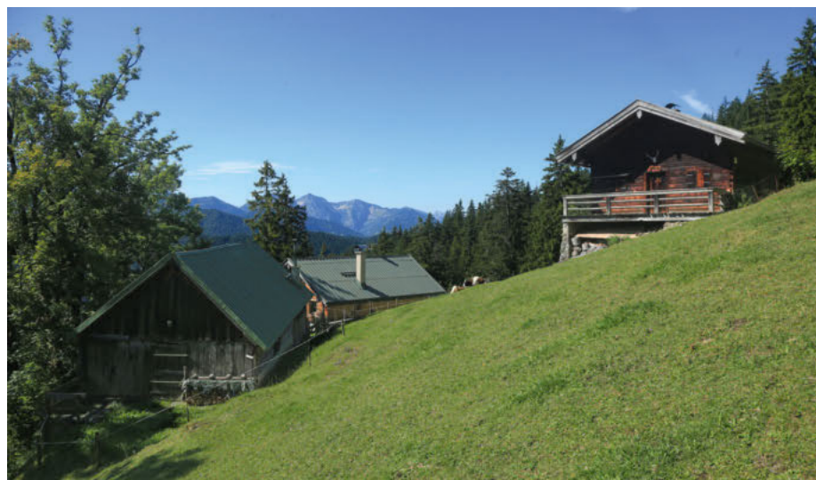
Der Sonnberg Niederleger hat nur eine Almlichte von 0,6 Hektar.