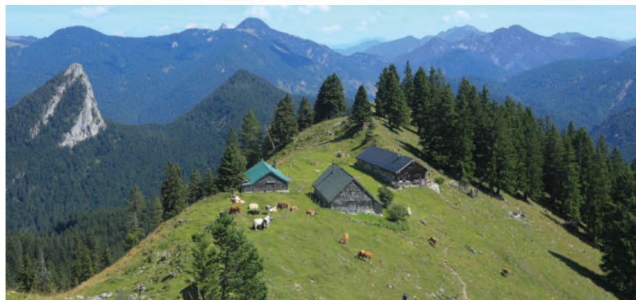
Der nicht erschlossene Sonnberg Hochleger auf 1.498 m mit allen Almhütten.