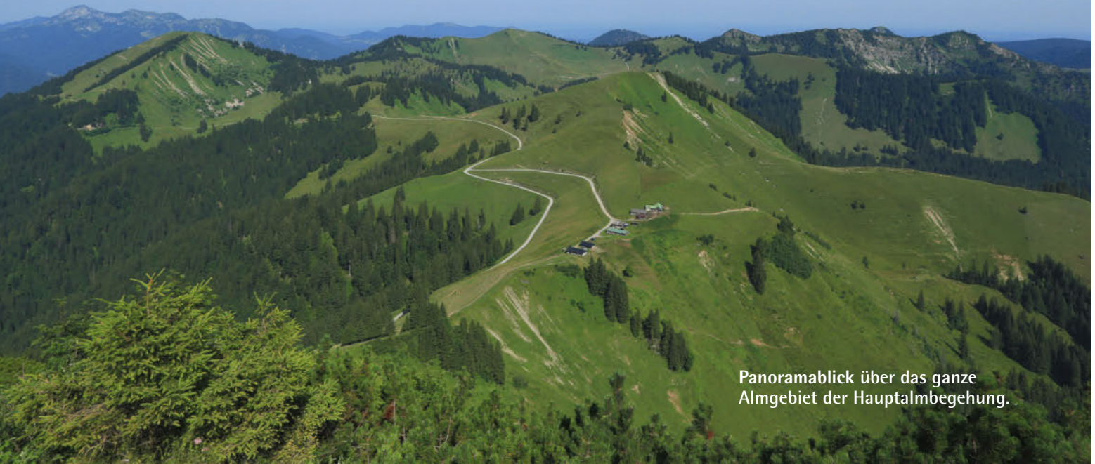
Panoramablick über das ganze Almgebiet der Hauptalmbegehung.